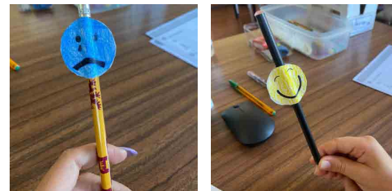
Exemplos dos lápis triste e alegre

Podes colar fazer quatro taumatrópios diferentes, um para cada emoção, e usar cada lápis consoante a emoção que tiveres no momento.