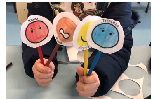
↑ Exemplos de lápis ↓

Pinta as caras à esquerda e direita. Recorta os círculos com a ajuda de um adulto. Cola cada círculo no verso do outro com um lápis no meio. Põe o lápis entre as mãos e gira o pau como que a esfregar as mãos. Consegues ver a emoção a ir e a vir?