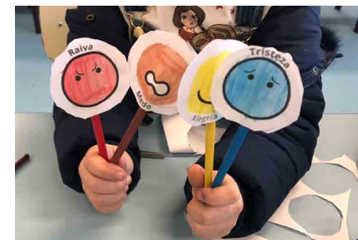
Exemplos dos 4 lápis

Podes colar fazer quatro taumatrópios diferentes, um para cada emoção, e usar cada lápis consoante a emoção que tiveres no momento.